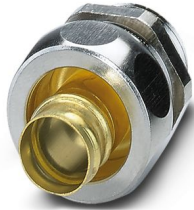
Connessione a vite in ottone con filettatura Pg, grado di protezione IP65

Si prega di notare che i dati visualizzati in questo PDF sono stati generati dal nostro catalogo online. I dati completi sono disponibili nella documentazione per l'utente. Si applicano le condizioni generali di utilizzo per i download.