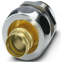
Connessione a vite in ottone con filettatura Pg, grado di protezione IP65

Si prega di notare che i dati visualizzati in questo PDF sono stati generati dal nostro catalogo online. I dati completi sono disponibili nella documentazione per l'utente. Si applicano le condizioni generali di utilizzo per i download.