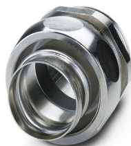
Connessione a vite in ottone con filettatura Pg, grado di protezione IP40

Si prega di notare che i dati visualizzati in questo PDF sono stati generati dal nostro catalogo online. I dati completi sono disponibili nella documentazione per l'utente. Si applicano le condizioni generali di utilizzo per i download.