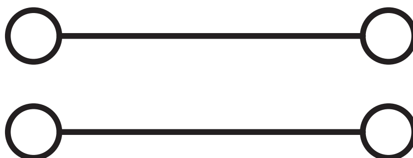
Schema di collegamento