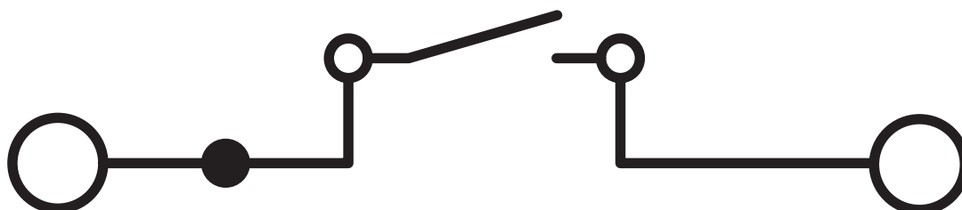
Schema di collegamento