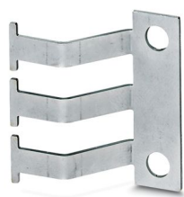
Connettore assorbimento cavo EMC, materiale: Acciaio inossidabile

Si prega di notare che i dati visualizzati in questo PDF sono stati generati dal nostro catalogo online. I dati completi sono disponibili nella documentazione per l'utente. Si applicano le condizioni generali di utilizzo per i download.