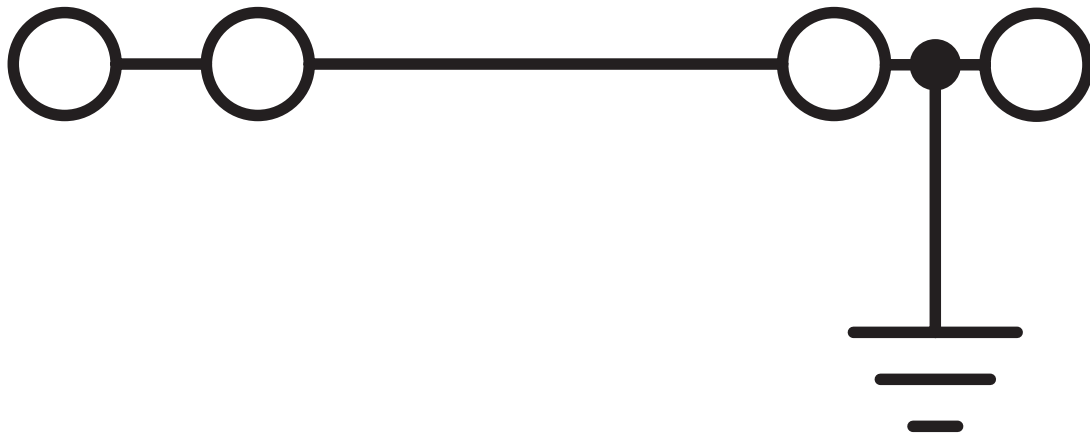
Schema di collegamento