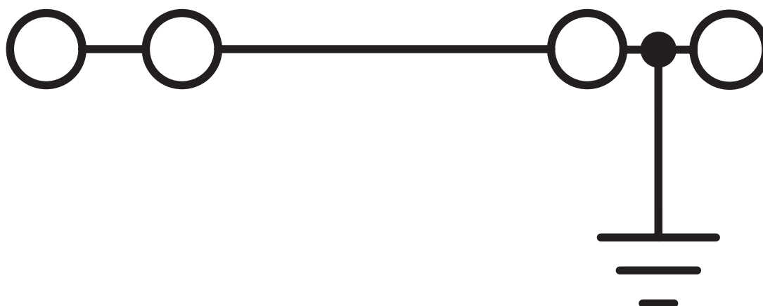
Schema di collegamento