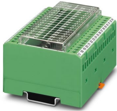
Modulo con 32 diodi, anodo in comune, tipo diodo 1N 4007

Si prega di notare che i dati visualizzati in questo PDF sono stati generati dal nostro catalogo online. I dati completi sono disponibili nella documentazione per l'utente. Si applicano le condizioni generali di utilizzo per i download.