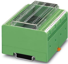
Moduli con 17 diodi, collegamento singolo, tipo 1N 4007

Si prega di notare che i dati visualizzati in questo PDF sono stati generati dal nostro catalogo online. I dati completi sono disponibili nella documentazione per l'utente. Si applicano le condizioni generali di utilizzo per i download.