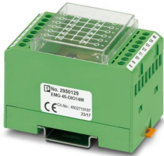
Modulo con 14 diodi, anodo in comune, tipo diodo 1N 4007

Si prega di notare che i dati visualizzati in questo PDF sono stati generati dal nostro catalogo online. I dati completi sono disponibili nella documentazione per l'utente. Si applicano le condizioni generali di utilizzo per i download.