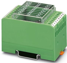
Moduli con 8 diodi, tipo diodo 1N 4007

Si prega di notare che i dati visualizzati in questo PDF sono stati generati dal nostro catalogo online. I dati completi sono disponibili nella documentazione per l'utente. Si applicano le condizioni generali di utilizzo per i download.