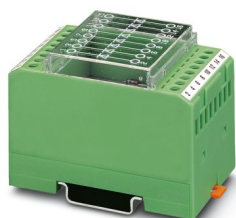
Moduli con 8 diodi, tipo diodo 1N 4007

Si prega di notare che i dati visualizzati in questo PDF sono stati generati dal nostro catalogo online. I dati completi sono disponibili nella documentazione per l'utente. Si applicano le condizioni generali di utilizzo per i download.