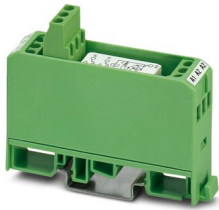
La figura illustra la versione EMG 17-REL/KSR-24/21-21-LC AU, con relè saldato

Si prega di notare che i dati visualizzati in questo PDF sono stati generati dal nostro catalogo online. I dati completi sono disponibili nella documentazione per l'utente. Si applicano le condizioni generali di utilizzo per i download.