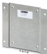
Piastra di montaggio per switch SFNT

Si prega di notare che i dati visualizzati in questo PDF sono stati generati dal nostro catalogo online. I dati completi sono disponibili nella documentazione per l'utente. Si applicano le condizioni generali di utilizzo per i download.