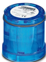
Elemento luce fisso LED, 24 V AC/DC, blu

Si prega di notare che i dati visualizzati in questo PDF sono stati generati dal nostro catalogo online. I dati completi sono disponibili nella documentazione per l'utente. Si applicano le condizioni generali di utilizzo per i download.