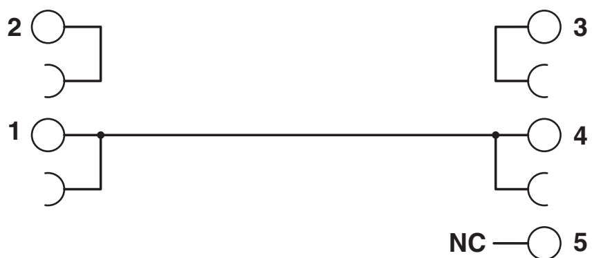
Schema di collegamento PLC-VT