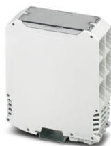
La figura mostra la variante della custodia ME MAX 35 LC 3-3

Si prega di notare che i dati visualizzati in questo PDF sono stati generati dal nostro catalogo online. I dati completi sono disponibili nella documentazione per l'utente. Si applicano le condizioni generali di utilizzo per i download.