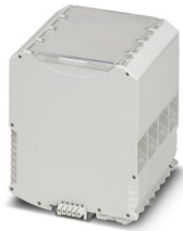
La figura mostra una versione equipaggiata

Si prega di notare che i dati visualizzati in questo PDF sono stati generati dal nostro catalogo online. I dati completi sono disponibili nella documentazione per l'utente. Si applicano le condizioni generali di utilizzo per i download.