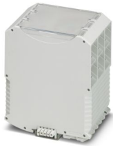
La figura mostra una versione equipaggiata

Si prega di notare che i dati visualizzati in questo PDF sono stati generati dal nostro catalogo online. I dati completi sono disponibili nella documentazione per l'utente. Si applicano le condizioni generali di utilizzo per i download.