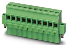
La figura illustra la versione a 10 poli dell'articolo

Connettore per circuiti stampati, sezione nominale: 2,5 mm 2 , colore: verde, corrente nominale: 16 A (vedere curva derating), tensione di dimensionamento (III/2): 320 V, superficie contatti: Sn, tipo di connessione del contatto: Femmina, numero dei potenziali: 5, numero di file: 1, numero poli: 5, numero di connessioni: 5, serie di prodotti: MVSTBW 2,5 HC/..-STF, passo: 5 mm, tipo di connessione: Connessione a vite con gabbia, forma di attacco delle viti: L Fessura longitudinale, direzione di collegamento conduttore/scheda: -90 °, gancio di bloccaggio: - Gancio di bloccaggio, sistema di spine: COMBICON MSTB 2,5 HC, bloccaggio: Bloccaggio a vite, tipo di fissaggio: Flangia a vite, tipo di confezione: confezionato nel cartone