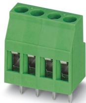
La figura illustra la variante a 4 poli

Morsetto circuito stampato, corrente nominale: 24 A, tensione di dimensionamento (III/2): 400 V, sezione nominale: 2,5 mm 2 , numero dei potenziali: 9, numero di file: 1, numero di poli per fila: 9, serie di prodotti: MKDSB 3, passo: 5 mm, tipo di connessione: Connessione a vite con gabbia, forma di attacco delle viti: L Fessura longitudinale, montaggio: Saldatura a onde, direzione di collegamento conduttore/scheda: 0 °, colore: verde, Layout Pin: Pinning lineare, Lunghezza pin [P]: 4 mm, numero di pin di saldatura per potenziale: 1, tipo di confezione: confezionato nel cartone. Articolo con fondo