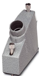
La figura illustra la variante VC-MP-T3-R

Si prega di notare che i dati visualizzati in questo PDF sono stati generati dal nostro catalogo online. I dati completi sono disponibili nella documentazione per l'utente. Si applicano le condizioni generali di utilizzo per i download.