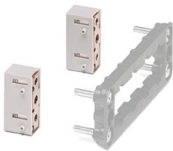
La figura illustra la flangia da incasso con il telaio da incasso VC-AR1/2M

Si prega di notare che i dati visualizzati in questo PDF sono stati generati dal nostro catalogo online. I dati completi sono disponibili nella documentazione per l'utente. Si applicano le condizioni generali di utilizzo per i download.