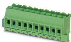
La figura illustra la versione a 10 poli dell'articolo

Blocco a innesto diretto, sezione nominale: 2,5 mm 2 , colore: verde, corrente nominale: 12 A, tensione di dimensionamento (III/2): 320 V, superficie contatti: Sn, tipo di connessione del contatto: Spina, numero dei potenziali: 8, numero di file: 1, numero poli: 8, numero di connessioni: 8, serie di prodotti: MVSTBU 2,5/...-GB, passo: 5,08 mm, tipo di connessione: Connessione a vite con gabbia, forma di attacco delle viti: L Fessura longitudinale, montaggio: Montaggio diretto, direzione di collegamento conduttore/scheda: 0 °, numero di pin di saldatura per potenziale: 1, sistema di spine: COMBICON MSTB 2,5, bloccaggio: assente, tipo di fissaggio: assente, tipo di confezione: confezionato nel cartone