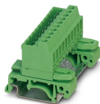
La figura illustra la versione a 10 poli dell'articolo

Connettore della guida, sezione nominale: 2,5 mm 2 , colore: verde, corrente nominale: 12 A, tensione di dimensionamento (III/2): 320 V, superficie contatti: Sn, tipo di connessione del contatto: Spina, numero dei potenziali: 3, numero di file: 1, numero poli: 3, numero di connessioni: 3, serie di prodotti: UMSTBVK 2,5/...-G, passo: 5,08 mm, tipo di connessione: Connessione a vite con gabbia, forma di attacco delle viti: L Fessura longitudinale, montaggio: Montaggio su guida DIN, direzione di collegamento conduttore/scheda: 0 °, numero di pin di saldatura per potenziale: 1, sistema di spine: COMBICON MSTB 2,5, bloccaggio: assente, tipo di fissaggio: assente, tipo di confezione: confezionato nel cartone