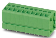
La figura mostra la versione a 10 poli

Morsetto circuito stampato, corrente nominale: 24 A, tensione di dimensionamento (III/2): 400 V, sezione nominale: 2,5 mm 2 , numero dei potenziali: 11, numero di file: 1, numero di poli per fila: 11, serie di prodotti: FRONT 2,5-V/SA10, passo: 5 mm, tipo di connessione: Connessione a vite frontale, montaggio: Saldatura a onde, direzione di collegamento conduttore/scheda: 90 °, colore: verde, Layout Pin: Pinning lineare, Lunghezza pin [P]: 5 mm, numero di pin di saldatura per potenziale: 2, tipo di confezione: confezionato nel cartone. L'articolo può essere allineato con diversi numeri di poli!