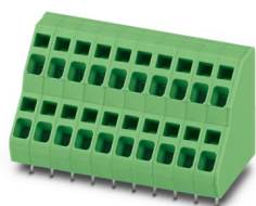
La figura mostra la versione a 10 poli

Morsetto circuito stampato, corrente nominale: 17,5 A, tensione di dimensionamento (III/2): 400 V, sezione nominale: 2,5 mm 2 , numero dei potenziali: 64, numero di file: 2, numero di poli per fila: 32, serie di prodotti: ZFKKDS(A) 2,5, passo: 5,08 mm, tipo di connessione: Connessione a molla, montaggio: Saldatura a onde, direzione di collegamento conduttore/scheda: 45 °, colore: verde, Layout Pin: Pinning lineare, Lunghezza pin [P]: 3,5 mm, numero di pin di saldatura per potenziale: 1, tipo di confezione: confezionato nel cartone