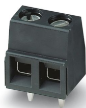
La figura mostra una versione a 2 poli

Morsetto circuito stampato, corrente nominale: 13,5 A, tensione di dimensionamento (III/2): 320 V, sezione nominale: 1,5 mm 2 , numero dei potenziali: 8, numero di file: 1, numero di poli per fila: 8, serie di prodotti: MKDSN 1,5/..-HT, passo: 5 mm, tipo di connessione: Connessione a vite con gabbia, forma di attacco delle viti: L Fessura longitudinale, montaggio: Saldatura TTHR / ad onde, direzione di collegamento conduttore/scheda: 0 °, colore: nero, Layout Pin: Pinning lineare, Lunghezza pin [P]: 3,5 mm, numero di pin di saldatura per potenziale: 1, tipo di confezione: confezionato nel cartone