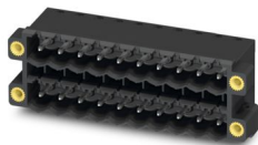
La figura illustra la variante a 10 poli con 20 contatti

Preso base per circuiti stampati, sezione nominale: 2,5 mm 2 , colore: nero, corrente nominale: 12 A, tensione di dimensionamento (III/2): 320 V, superficie contatti: Sn, tipo di connessione del contatto: Spina, numero dei potenziali: 36, numero di file: 2, numero poli: 18, numero di connessioni: 36, serie di prodotti: CCDN 2,5/...-G1F-THR, passo: 5,08 mm, montaggio: Saldatura TTHR / ad onde, layout pin: Pinning lineare, lunghezza pin [P]: 2,6 mm, numero di pin di saldatura per potenziale: 1, sistema di spine: COMBICON FKCN 2,5 – CCDN 2,5, Orientamento pin d'inserimento: Standard, bloccaggio: Bloccaggio a vite, tipo di fissaggio: Flangia filettata, tipo di confezione: confezionato nel cartone