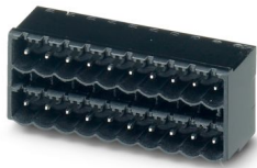
La figura illustra la variante a 10 poli con 20 contatti

Preso base per circuiti stampati, sezione nominale: 2,5 mm 2 , colore: nero, corrente nominale: 12 A, tensione di dimensionamento (III/2): 320 V, superficie contatti: Sn, tipo di connessione del contatto: Spina, numero dei potenziali: 34, numero di file: 2, numero poli: 17, numero di connessioni: 34, serie di prodotti: CCDN 2,5/..-G1-THR, passo: 5,08 mm, montaggio: Saldatura TTHR / ad onde, layout pin: Pinning lineare, lunghezza pin [P]: 2,6 mm, numero di pin di saldatura per potenziale: 1, sistema di spine: COMBICON FKCN 2,5 – CCDN 2,5, Orientamento pin d'inserimento: Standard, bloccaggio: assente, tipo di fissaggio: assente, tipo di confezione: confezionato nel cartone