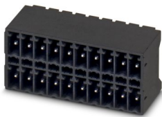
La figura illustra la variante a 10 poli con 20 contatti

Preso base per circuiti stampati, sezione nominale: 1,5 mm 2 , colore: nero, corrente nominale: 8 A, tensione di dimensionamento (III/2): 160 V, superficie contatti: Sn, tipo di connessione del contatto: Spina, numero dei potenziali: 20, numero di file: 2, numero poli: 10, numero di connessioni: 20, serie di prodotti: MCDN 1,5/...-G1-THR, passo: 3,81 mm, montaggio: Saldatura TTHR / ad onde, layout pin: Pinning lineare, lunghezza pin [P]: 2,6 mm, numero di pin di saldatura per potenziale: 1, sistema di spine: COMBICON FMC 1,5 - MCDN 1,5, Orientamento pin d'inserimento: Standard, bloccaggio: assente, tipo di fissaggio: assente, tipo di confezione: confezionato nel cartone, La lunghezza pin è pari a 2,6 mm. Le informazioni per l'utente e le proposte di progettazione per la tecnologia Through Hole Reflow sono indicate nella pagina: "Download"