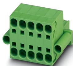
La figura illustra la versione a 5 poli dell'articolo

Connettore TWIN per circuiti stampati, sezione nominale: 6 mm 2 , colore: verde, corrente nominale: 32 A, tensione di dimensionamento (III/2): 1000 V, superficie contatti: Sn, tipo di connessione del contatto: Femmina, numero dei potenziali: 10, numero di file: 1, numero poli: 10, numero di connessioni: 20, serie di prodotti: TSPC 5/..-STF, passo: 7,62 mm, tipo di connessione: Connessione a molla Push-in, direzione di collegamento conduttore/scheda: 0 °, gancio di bloccaggio: - senza gancio di bloccaggio, sistema di spine: COMBICON PC 5, bloccaggio: Bloccaggio a vite, tipo di fissaggio: Flangia a vite, tipo di confezione: confezionato nel cartone