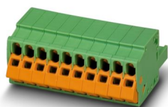
La figura illustra la versione a 10 poli dell'articolo

Connettore per circuiti stampati, sezione nominale: 1,5 mm 2 , colore: verde, corrente nominale: 12 A, tensione di dimensionamento (III/2): 630 V, superficie contatti: Sn, tipo di connessione del contatto: Femmina, numero dei potenziali: 12, numero di file: 1, numero poli: 12, numero di connessioni: 12, serie di prodotti: QC 1,5/..-ST, passo: 5 mm, tipo di connessione: Connessione a perforazione d'isolante, direzione di collegamento conduttore/scheda: 0 °, gancio di bloccaggio: - Gancio di bloccaggio, sistema di spine: COMBICON MSTB 2,5, bloccaggio: assente, tipo di fissaggio: assente, tipo di confezione: confezionato nel cartone