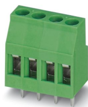
La figura illustra la variante a 4 poli

Morsetto circuito stampato, corrente nominale: 24 A, tensione di dimensionamento (III/2): 400 V, sezione nominale: 2,5 mm 2 , numero dei potenziali: 2, numero di file: 1, numero di poli per fila: 2, serie di prodotti: MKDSB 3, passo: 5,08 mm, tipo di connessione: Connessione a vite con gabbia, forma di attacco delle viti: L Fessura longitudinale, montaggio: Saldatura a onde, direzione di collegamento conduttore/scheda: 0 °, colore: verde, Layout Pin: Pinning lineare, Lunghezza pin [P]: 4 mm, numero di pin di saldatura per potenziale: 1, tipo di confezione: confezionato nel cartone. Articolo con fondo