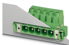
La figura illustra la versione a 5 poli dell'articolo

Connettore di passaggio, sezione nominale: 16 mm 2 , colore: verde, corrente nominale: 76 A, tensione di dimensionamento (III/2): 1000 V, superficie contatti: Ag, tipo di connessione del contatto: Spina, numero dei potenziali: 8, numero di file: 1, numero poli: 8, numero di connessioni: 8, serie di prodotti: DFK-PC 16/..-STF-SH, passo: 10,16 mm, tipo di connessione: Connessione a vite con gabbia, forma di attacco delle viti: L Fessura longitudinale, direzione di collegamento conduttore/scheda: 0 °, lunghezza pin [P]: 4,1 mm, sistema di spine: COMBICON PC 16, Caratteristiche elettriche: schermato, Orientamento pin d'inserimento: Standard, bloccaggio: Bloccaggio a vite, tipo di fissaggio: Flangia a vite, tipo di confezione: confezionato nel cartone