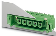
La figura illustra la versione a 5 poli dell'articolo

Custodie passaparete, sezione nominale: 16 mm 2 , colore: verde, corrente nominale: 76 A, tensione di dimensionamento (III/2): 1000 V, superficie contatti: Ag, tipo di connessione del contatto: Femmina, numero dei potenziali: 7, numero di file: 1, numero poli: 7, numero di connessioni: 7, serie di prodotti: DFK-IPC 16/..-GF, passo: 10,16 mm, montaggio: Saldatura a onde, layout pin: Pinning lineare, lunghezza pin [P]: 3,8 mm, numero di pin di saldatura per potenziale: 3, sistema di spine: COMBICON PC 16, Orientamento pin d'inserimento: Standard, bloccaggio: Bloccaggio a vite, tipo di fissaggio: Flangia filettata, tipo di confezione: confezionato nel cartone