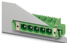
La figura illustra la versione a 5 poli dell'articolo

Custodie passaparete, sezione nominale: 16 mm 2 , colore: verde, corrente nominale: 76 A, tensione di dimensionamento (III/2): 1000 V, superficie contatti: Ag, tipo di connessione del contatto: Spina, numero dei potenziali: 4, numero di file: 1, numero poli: 4, numero di connessioni: 4, serie di prodotti: DFK-PC 6-16/..-GF, passo: 10,16 mm, montaggio: Saldatura a onde, layout pin: Pinning lineare, lunghezza pin [P]: 4,1 mm, numero di pin di saldatura per potenziale: 3, sistema di spine: COMBICON PC 16, Orientamento pin d'inserimento: Standard, bloccaggio: Bloccaggio a vite, tipo di fissaggio: Flangia filettata, tipo di confezione: confezionato nel cartone