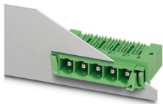
La figura illustra la versione a 5 poli dell'articolo

Custodie passaparete, sezione nominale: 16 mm 2 , colore: verde, corrente nominale: 76 A, tensione di dimensionamento (III/2): 1000 V, superficie contatti: Ag, tipo di connessione del contatto: Spina, numero dei potenziali: 8, numero di file: 1, numero poli: 8, numero di connessioni: 8, serie di prodotti: DFK-PC 6-16/...-G, passo: 10,16 mm, montaggio: Saldatura a onde, layout pin: Pinning lineare, lunghezza pin [P]: 4,1 mm, numero di pin di saldatura per potenziale: 3, sistema di spine: COMBICON PC 16, Orientamento pin d'inserimento: Standard, bloccaggio: assente, tipo di fissaggio: assente, tipo di confezione: confezionato nel cartone