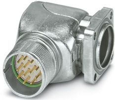
La figura mostra la versione a 12 poli

Si prega di notare che i dati visualizzati in questo PDF sono stati generati dal nostro catalogo online. I dati completi sono disponibili nella documentazione per l'utente. Si applicano le condizioni generali di utilizzo per i download.