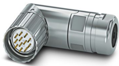
La figura mostra la versione a 12 poli

Si prega di notare che i dati visualizzati in questo PDF sono stati generati dal nostro catalogo online. I dati completi sono disponibili nella documentazione per l'utente. Si applicano le condizioni generali di utilizzo per i download.