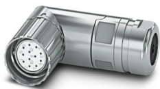
La figura mostra la versione a 12 poli

Si prega di notare che i dati visualizzati in questo PDF sono stati generati dal nostro catalogo online. I dati completi sono disponibili nella documentazione per l'utente. Si applicano le condizioni generali di utilizzo per i download.