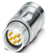
La figura mostra la versione a 6 poli con contatti a saldare

Si prega di notare che i dati visualizzati in questo PDF sono stati generati dal nostro catalogo online. I dati completi sono disponibili nella documentazione per l'utente. Si applicano le condizioni generali di utilizzo per i download.