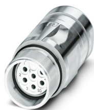
La figura mostra la versione a 6 poli

Si prega di notare che i dati visualizzati in questo PDF sono stati generati dal nostro catalogo online. I dati completi sono disponibili nella documentazione per l'utente. Si applicano le condizioni generali di utilizzo per i download.