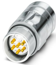
La figura mostra la versione a 6 poli con contatti a saldare

Si prega di notare che i dati visualizzati in questo PDF sono stati generati dal nostro catalogo online. I dati completi sono disponibili nella documentazione per l'utente. Si applicano le condizioni generali di utilizzo per i download.