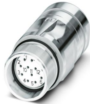
La figura mostra la versione a 12 poli

Si prega di notare che i dati visualizzati in questo PDF sono stati generati dal nostro catalogo online. I dati completi sono disponibili nella documentazione per l'utente. Si applicano le condizioni generali di utilizzo per i download.