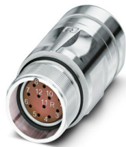
La figura mostra la versione a 12 poli

Si prega di notare che i dati visualizzati in questo PDF sono stati generati dal nostro catalogo online. I dati completi sono disponibili nella documentazione per l'utente. Si applicano le condizioni generali di utilizzo per i download.