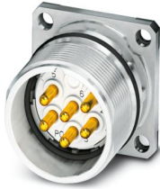
La figura mostra la versione a 6 poli con contatti a saldare

Si prega di notare che i dati visualizzati in questo PDF sono stati generati dal nostro catalogo online. I dati completi sono disponibili nella documentazione per l'utente. Si applicano le condizioni generali di utilizzo per i download.