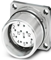
La figura mostra la versione a 12 poli

Si prega di notare che i dati visualizzati in questo PDF sono stati generati dal nostro catalogo online. I dati completi sono disponibili nella documentazione per l'utente. Si applicano le condizioni generali di utilizzo per i download.