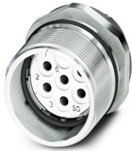
La figura mostra la versione a 6 poli

Si prega di notare che i dati visualizzati in questo PDF sono stati generati dal nostro catalogo online. I dati completi sono disponibili nella documentazione per l'utente. Si applicano le condizioni generali di utilizzo per i download.