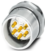
La figura mostra la versione a 6 poli con contatti a saldare

Si prega di notare che i dati visualizzati in questo PDF sono stati generati dal nostro catalogo online. I dati completi sono disponibili nella documentazione per l'utente. Si applicano le condizioni generali di utilizzo per i download.