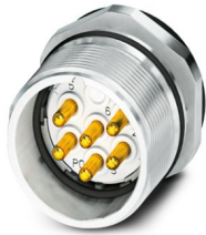
La figura mostra la versione con contatti a saldare

Si prega di notare che i dati visualizzati in questo PDF sono stati generati dal nostro catalogo online. I dati completi sono disponibili nella documentazione per l'utente. Si applicano le condizioni generali di utilizzo per i download.