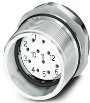
La figura mostra la versione a 12 poli

Si prega di notare che i dati visualizzati in questo PDF sono stati generati dal nostro catalogo online. I dati completi sono disponibili nella documentazione per l'utente. Si applicano le condizioni generali di utilizzo per i download.